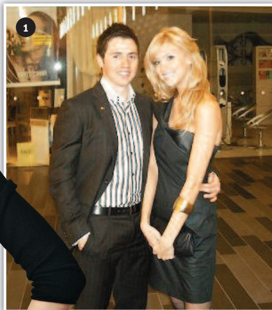
1- Un moment de détente pour les amoureux à Vancouver