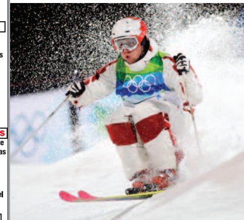
Alexandre Bilodeau lors de ses récentes prouesses aux Jeux olympiques